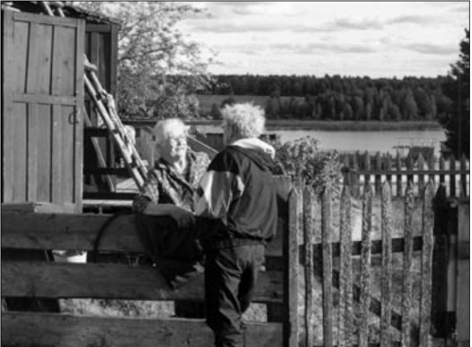
Markovin mummon starinoilla.