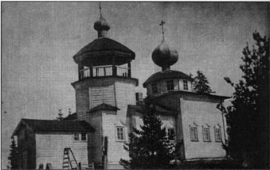
Repolan ortodoksinen kirkko vuonna 1936. Nyt tätä kirkkoa ei enää ole.

johtuen huonosta hoidosta sekä hallinto- ja palvelualojen korkeista kustannuksista. Kolhoosien johto oli heikko, työkuri huono, puuttui kirjanpitäjiä, karjanhoito leväperäistä, perunat ja kaalit paleltuivat pellolle, ei ollut työvaatteita, ei lamppuöljyä, ei tulitikkuja ja mahorkkaa eikä suolaa. Elintarvikenormit olivat matalat ja hinnat korkeat.