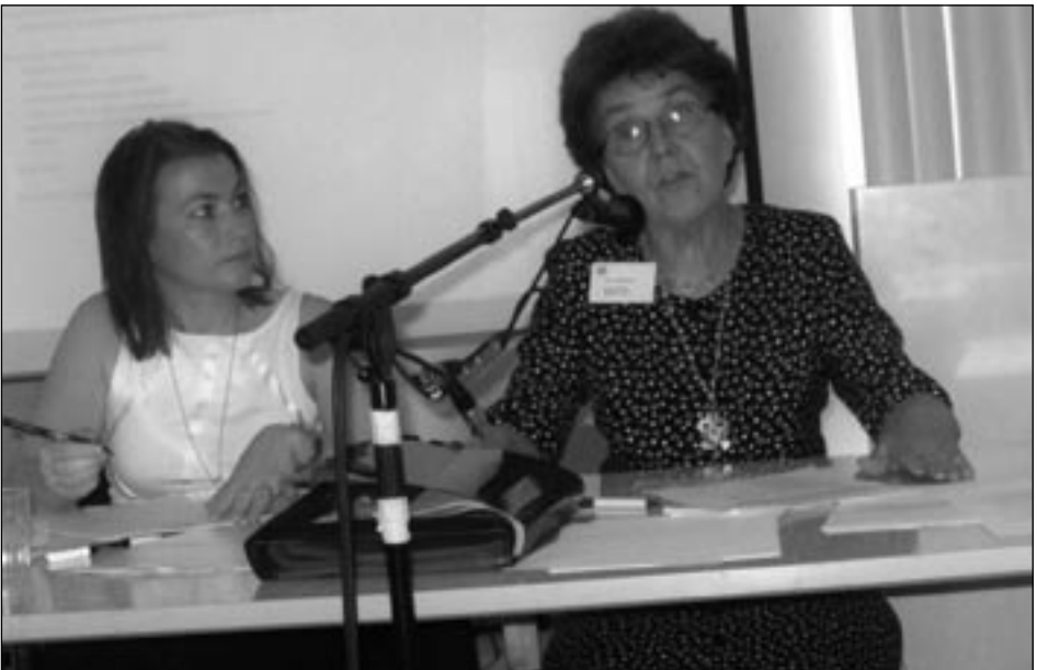
Puheenjohtaja yhteistyöseurojen kokouksessa.

Jäsenistömme noin 200-300 henkilöjäsentä ovat melko iäkkäitä. Tästä johtuen jäsenten siirtyminen tuonilmaisiin aiheuttaa vääjäämätöntä jäsenmäärän