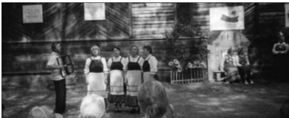
Lauluryhmä joka lauloi suomalaisia lauluja