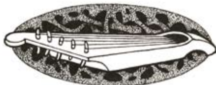
Kuvat: Aleksei Maksimov

Juminkeko/Merja Kähkönen www.juminkeko.fi