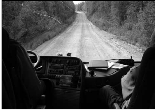
Repolan tiellä 2008

Koska Repolaisessa 48 ilmoitettu matka kiinnosti alustavasti noin 15 henkilöä, matka tehdään 17.–20.7.2009 (pe–su). Matkareitti perinteiseen tapaan Joensuusta Kuhmon ja Vartiuksen rajanylityspaikan kautta Repolaan. Matkan hinta noin 150 e sisältäen ryhmäviisumin, jos riittävä määrä lähtijöitä (25–30) ilmottautuu, ilman viisumia 110 e. Repolassa perhemajoitus ja täysihoito 60–80 e/ 3 vrk maksetaan majoittajille suoraan. Tiedustelut ja ilmottautumiset toukokuun loppuun mennessä matkatoimisto Matkahaitariin p. 0400 337 075 tai s-postilla jouko.brelo@kolumbus.fi.