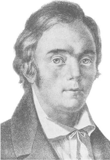
Elias Lönnrot 1802–1884

Kalevala on suomalaisten ja karjalaisten kansalliseepos. Se koostuu Vienen Karjalasta ja Itä-Suomesta kerätyistä vanhoista kansanrunoista, jotka siirtyivät sukupolvelta toiselle laulurunoina. Kajaanin piirilääkäri Elias Lönnrot keräsi 1820–1840-luvuilla runoja ja tutki aiempien kerääjien runoaineistoja. Näistä hän koos-