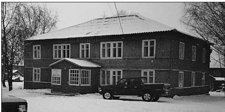
Lentieran lespromhoyin toimistorakennus

sia. Tuulijoen uitot loppuivat vuonna 1972 kokonaan, jolloin Tuulijärven kolmen metsätyökylän pitäminen asuttuna ei ollut metsätalouspiirille enää tarpeellista. Kun koulut, kaupat ja muut palvelut suljettiin, oli ihmisten muutettava Repolaan, Lentieraan tai vielä kauemaksi. Kylät tyhjenivät kokonaan muutamassa vuodessa. Kaksikymmentä vuotta kestänyt, neuvostomalliseen metsätalouteen perustunut asutusvaihe oli ohi Tuulijärven rannoilla.