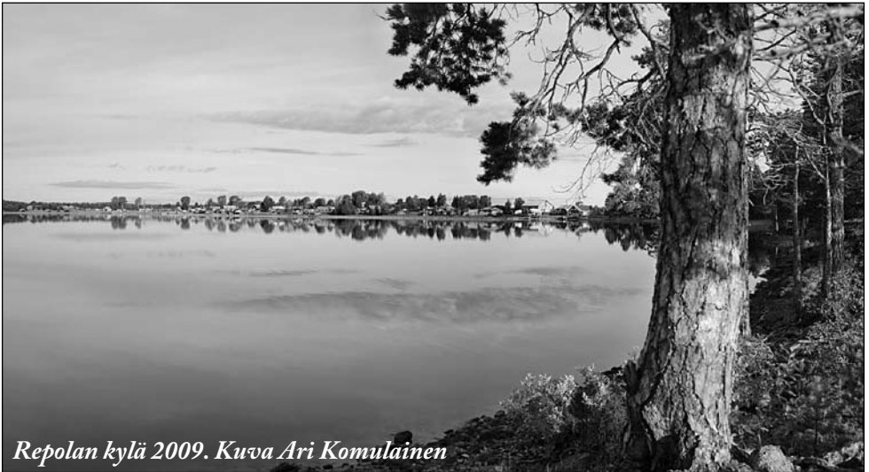
Repolan kylä 2009.