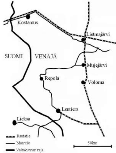
Repolan ympäristön liikenneverkko

Uiton loputtua Lieksanjoella alkoi Repolan syrjäisyys korostua ja kylän hiipuminen alkoi. Repolan metsätalouksiirin toiminta lakkautettiin vuonna 1986 ja alueen metsätalous siirrettiin uuden Mujejärven metsätalouksiiriin alaisuuteen. Mujejärven piirihallinnon alueella nykyisin toimivat neljä lespromhozia sijaitsivat radan varrella: Mujejärvi, Voloma, Lietmajärvi sekä Lentiera, jonne vedettyä pistorataa ei ole tosin tarvittu puunkuljetuksiin 1990-luvun alkuvuosien jälkeen.