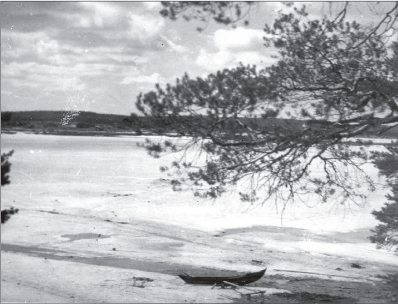
Rebolalaisen brihan kaihon kohde, Repolan maa

9. Kyllä tiijän, mipä koti on, kun mie nyt jo olen koditoin. Vapautta saavuttaissani, kadotin mie kalliin kotini.