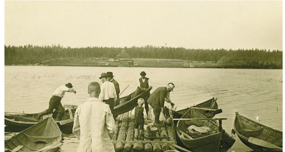
Naarajoki oli keskeinen paikka matkatessa Repolaan. Kuvassa kyläläisiä Naarajoen rannassa 1900-luvun alussa

”Yleinen talvitie kulkee Venäjän puolella olevista Rukajärven ja Repolan kunnista Lossin metsänvartijatorpan kautta, jossa myös talvitie Lentieran, Kipon, Kiimavaaran ja Pieningän kylistä sekä Porajärven kunnasta yhtyy edelliseen. Rautatien valmistuttua on liike kovasti kasvanut ja on erittäin vilkas, kun kaikki tarpeet on ostettava Suomesta. Tavallinen syöttöpaikka on Lossin metsänvartijatorppa, jossa useinkin on yöt päivät matkalaisia.”