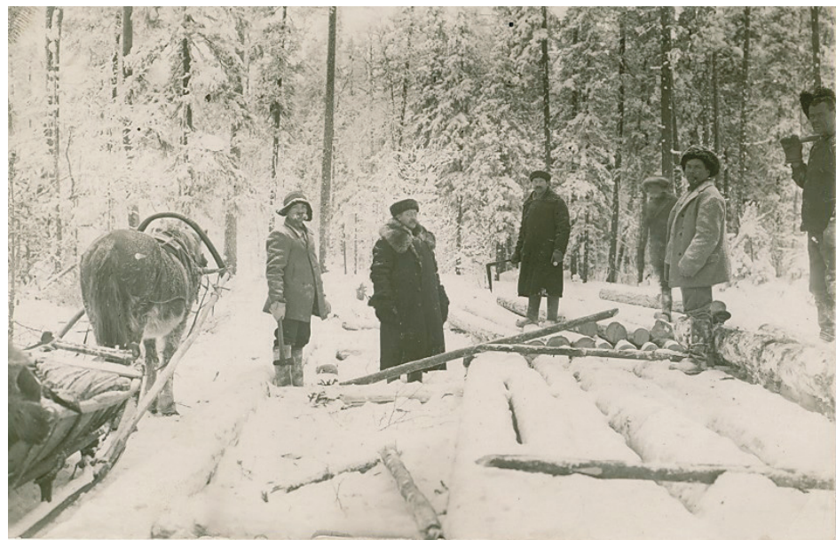
Repolan savotat ja rajauitto tarjosi työtä Ruunaan kylän miehille. Talvisavotat Repolassa

Rajauiton pääuittoväylänä toimineella Lieksanjoella uitto alkoi uudelleen sodan jälkeen vuonna 1957.