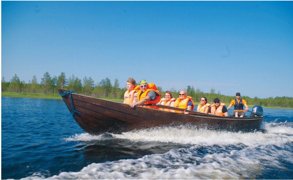
Uittoperinteeseen pohjautuvat koskenlaskut puuveneellä käynnistyivät Ruunaan koskilla 1970-luvun puolivälissä

tie ja pysäköintipaikka sekä alueen markkinoinnin ja koskenlaskujen käynnistyminen lisäsivät koskialueen kiinnostusta paikallisen väen ja matkailijoiden parissa.