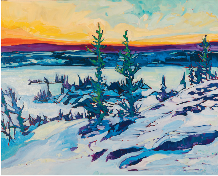
“Waning Twilight” öljy kankaalle. ”Haluan löytää ainutlaatuisen pohjoisen maiseman ytimen, sielun...”